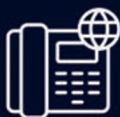
VOIX SUR IP